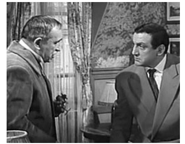
1958 LE GORILLE VOUS SALUE BIEN de Bernard Borderie avec Lino Ventura