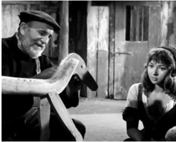
1958 LES NAUFRAGEURS de Charles Brabant avec Dany Carrel