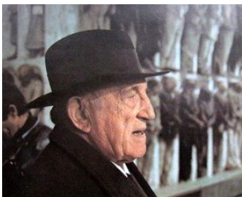
1976 CADAVRES EXQUIS (Cadaveri eccellenti) de Francesco Rosi