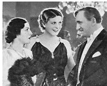
1935 VERTIGE D'UN SOIR / LA PEUR de Victor Tourjansky avec Gaby Morlay, Mireille Colussi