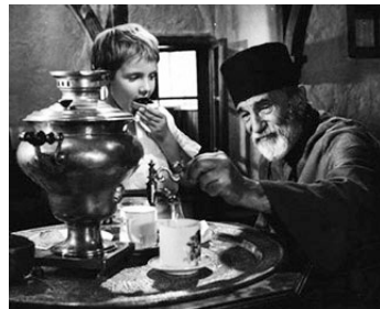
1961 LA STEPPE (La Steppa) d'Alberto Lattuada avec Daniele Spallone