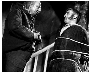
1933 LES MISÉRABLES de Raymond Bernard avec Harry Baur