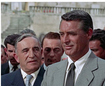
1955 LA MAIN AU COLLET (To catch a Thief) d'Alfred Hitchcock avec Cary Grant