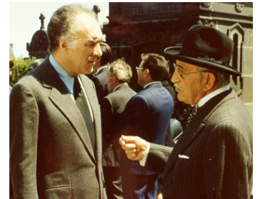
1974 SEPT MORTS SUR ORDONNANCE de Jacques Rouffio avec Michel Piccoli