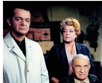
1969 COMPTES À REBOURS de Roger Pigaut avec Serge Reggiani, Simone Signoret