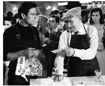
1957 LE PIÈGE de Charles Brabant avec Raf Vallone, Magali Noël