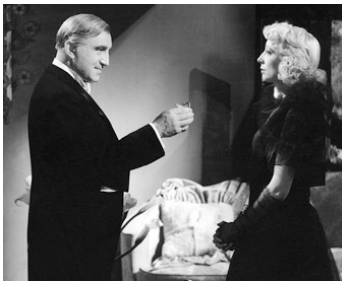
1938 CARREFOUR de Curtis Bernhardt avec Suzy Prim