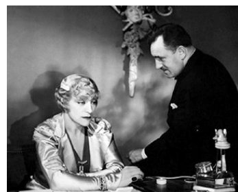
1936 JENNY de Marcel Carné avec Françoise Rosay