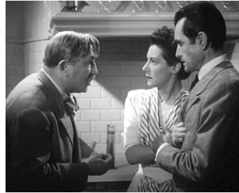
1941 LES AFFAIRES SONT LES AFFAIRES de Jean Dréville avec Renée Devillers, Lucien Nat