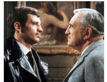
1963 L'AÎNÉ DES FERCHAUX de Jean-Pierre Melville avec Jean-Paul Belmondo