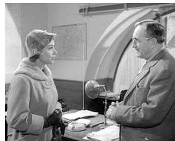
1956 SCANDALE À MILAN (Difendo il mio amore) de Giulio Macchi avec Martine Carol