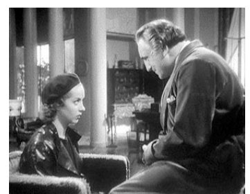
1937 ABUS DE CONFIANCE d'Henri Decoin avec Danielle Darrieux