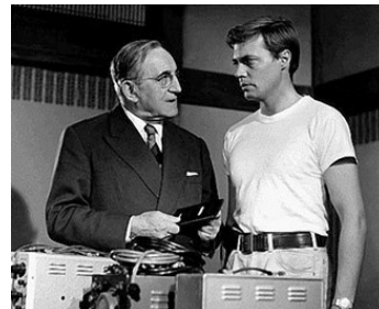
1962 RIFFIFI À TOKYO de Jacques Deray avec Karlheinz Boehm