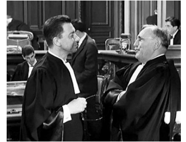
1960 LA VÉRITÉ d'Henri-Georges Clouzot avec Paul Meurisse