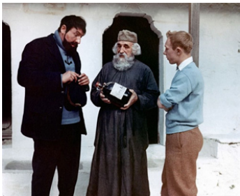
1961 TINTIN ET LE MYSTÈRE DE LA TOISON D'OR de J-J. Vierge avec Georges Wilson, J-P. Talbot