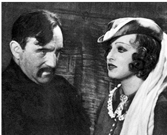
1934 MICHEL STROGOFF de Jacques de Baroncelli avec Colette Darfeuil