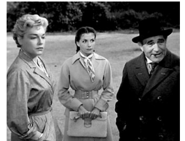
1954 LES DIABOLIQUES d'Henri-Georges Clouzot avec Simone Signoret, Vera Clouzot