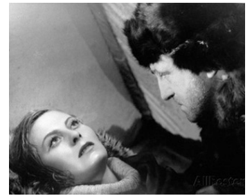
1939 LA LOI DU NORD de Jacques Feyder avec Michèle Morgan