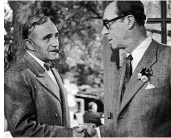
1948 LA FEMME QUE J'AI ASSASSINÉE de Jacques Daniel-Norman avec Armand Bernard