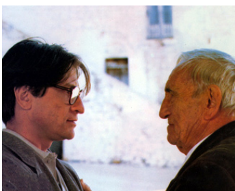
1980 TROIS FRÈRES (Tre Fratelli) de Francesco Rosi avec Vittorio Mezzogiorno