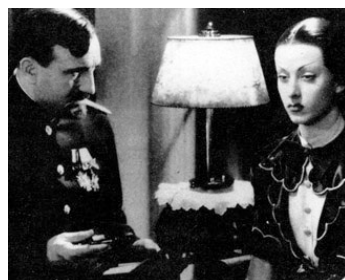
1936 PORT-ARTHUR de Nicolas Farkas avec Danielle Darrieux