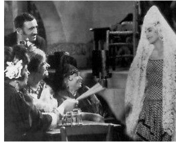
1930 MAISON DE DANSES de Maurice Tourneur avec Gaby Morlay