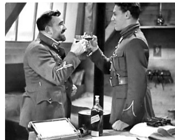
1935 L'ÉQUIPAGE d'Anatole Litvak avec Jean-Pierre Aumont