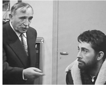
1959 PÊCHEUR D'ISLANDE de Pierre Schoendoerffer avec Jean-Claude Pascal