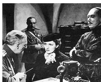
1936 LES BATeliers DE LA VOLGA de Vladimir Strijewski avec Véra Korène, Valery Inkijnoff