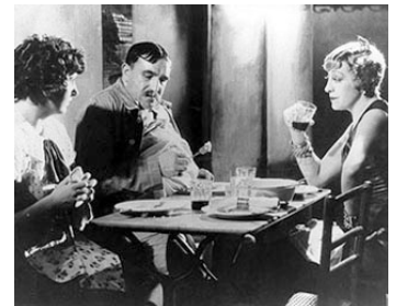
1934 LE GRAND JEU de Jacques Feyder avec Olga Vebria, Françoise Rosay