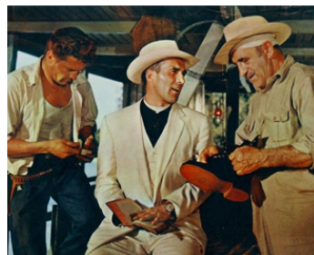
1956 LA MORT EN CE JARDIN de Luis Buñuel avec Georges Marchal, Michel Piccoli