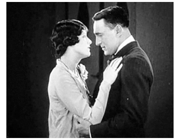
1926 LA PROIE DU VENT de René Clair avec Lillian Hall-Davis