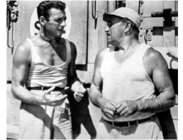
1952 LE SALAIRE DE LA PEUR d'Henri-Georges Clouzot avec Yves Montand