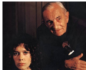
1977 ALICE OU LA DERNIÈRE FUGUE de Claude Chabrol avec Sylvia Kristel