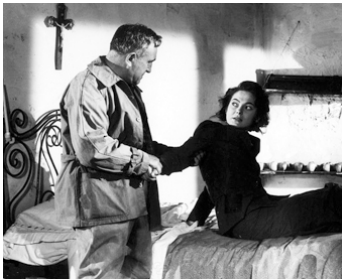
1953 UNE FILLE NOMMÉE MADELEINE (Maddalena) d'A. Genina avec Marta Toren