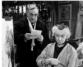
1954 L'AFFAIRE MAURIZIUS de Julien Duviver avec Berthe Bovy