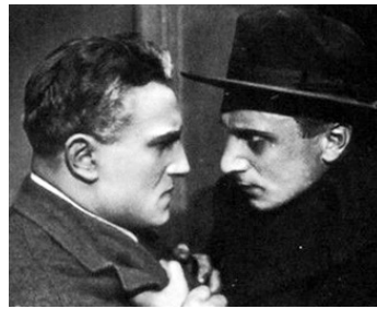
1922 TEMPÊTES de Robert Boudrioz avec Ivan Mosjoukine