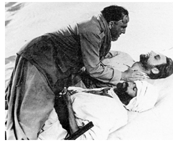
1939 S.O.S. SAHARA de Jacques de Baroncelli avec Hugues Wanner