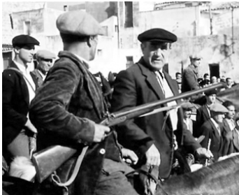
1948 AU NOM DE LA LOI (In nome della legge) de Pietro Germi