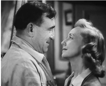
1943 LE CIEL EST À VOUS de Jean Grémillon avec Madeleine Renaud