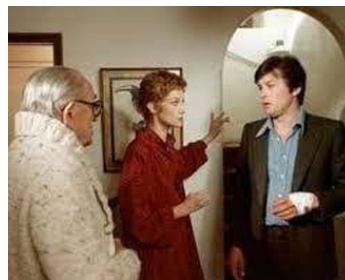
1976 COMME UN BOOMERANG de José Giovanni avec Carla Gravina, Alain Delon