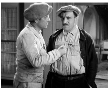
1935 LA BELLE ÉQUIPE de Julien Duvivier avec Jean Gabin