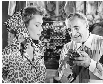
1957 RAFLES SUR LA VILLE de Pierre Chenal avec Bella Darvi