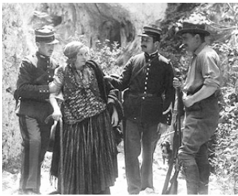
1920 MIARKA, FILLE DE L'OURS de Louis Mercanton avec Gabrielle Réjane