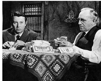
1963 SYMPHONIE POUR UN MASSACRE de Jacques Deray avec Michel Auclair