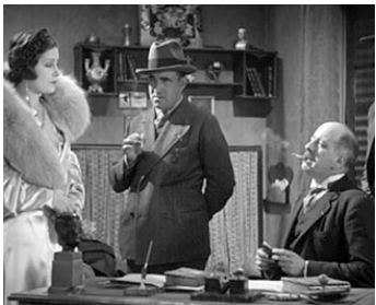
1931 AU NOM DE LA LOI de Maurice Tourneur avec Marcelle Chantal