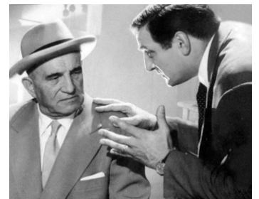
1956 LE FEU AUX POUDRES d'Henri Decoin avec Lino Ventura