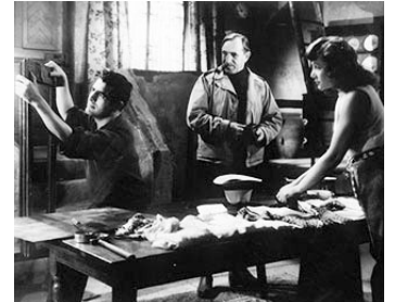
1947 LE DIABLE SOUFFLE d'Edmond T. Gréville avec Jean Chevrier, Hélène Bossis